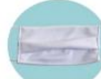
หน้ากากผ้า

หน้ากากผ้า : เหมาะสำหรับคนที่ไม่มีอาการป่วย สามารถดัดจับฝุ่นได้แต่ไม่ 100% ใช้แล้วซักนำกลับมาใช้ใหม่ได้