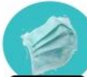
หน้ากากการแพทย์

หน้ากากผ้า : เหมาะสำหรับคนที่ไม่มีอาการป่วย สามารถดัดจับฝุ่นได้แต่ไม่ 100% ใช้แล้วซักนำกลับมาใช้ใหม่ได้